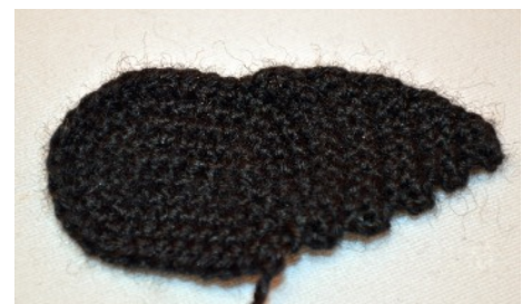
Flügel Neu kreiert (11.01.2019)