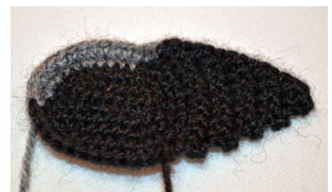
Flügel Neu kreiert (11.01.2019)

Fertigstellen, Lasse langen Faden für das Nähen