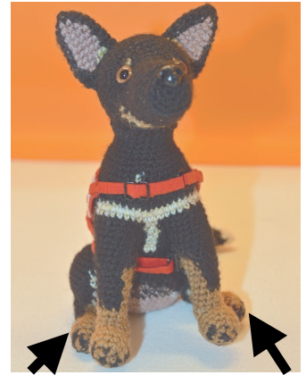
Rechter Fuss Linker Fuss